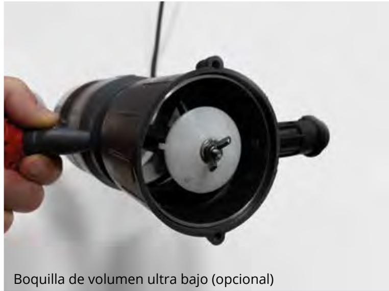
Boquilla de volumen ultra bajo (opcional)