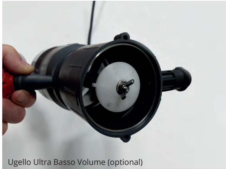
Ugello Ultra Basso Volume (optional)