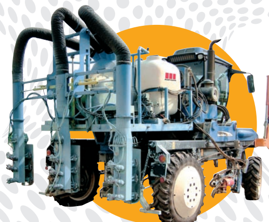
Trattamento localizzato: 3 file