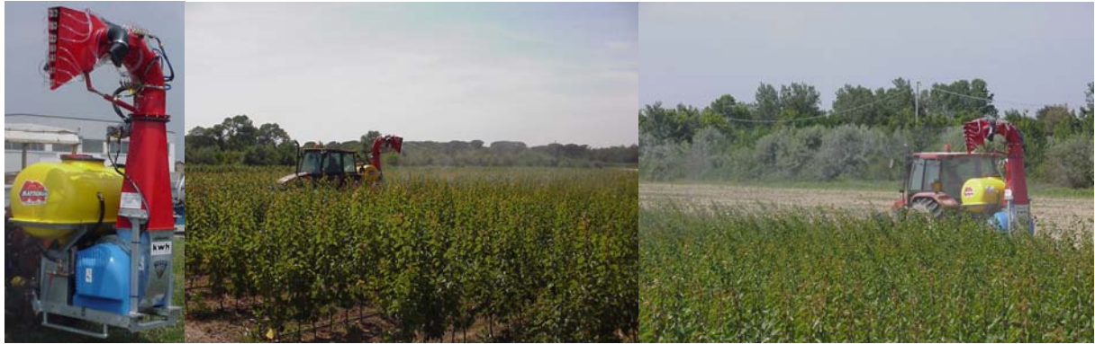
Diffusore sopraelevato a CANNONE con uscita a “VENTAGLIO”